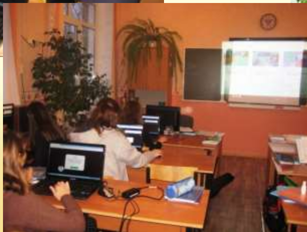
МБОУ Верхнеднепровская СОШ № 2