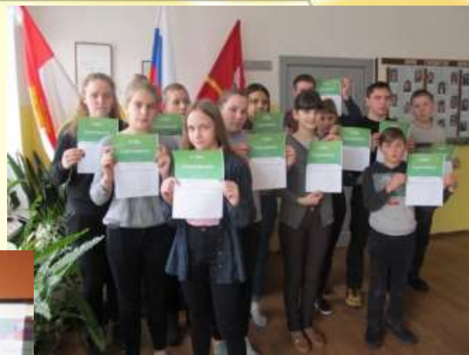
МБОУ Усвятская СОШ