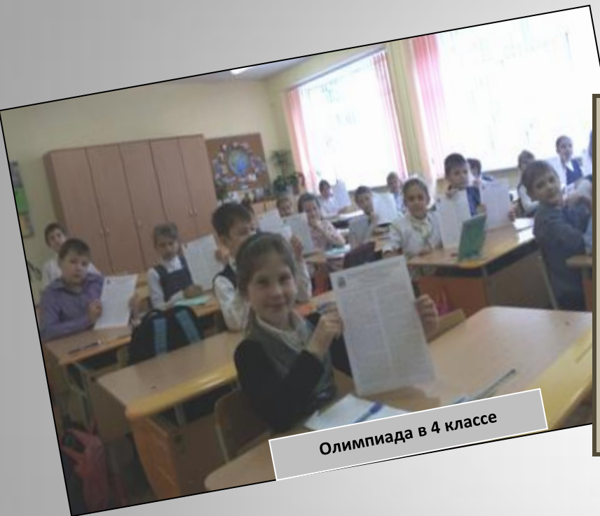
Олимпиада в 4 классе

В октябре каждого учебного года в школе проводится I тур предметной олимпиады по православной культуре