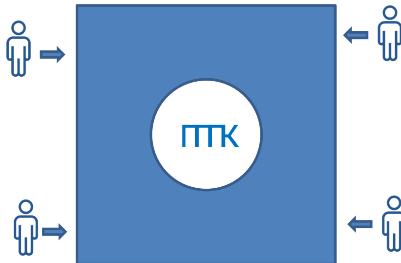
Модель организации ПППК в образовательной организации - ресурсном центре

Предполагает взаимодействие нескольких школ, расположенных в пределах транспортной доступности. В каждой ОО реализуются общеобразовательные дисциплины, а психолого - педагогические спецкурсы реализуются на базе одной из школ – ресурсном центре, обладающей соответствующими кадровыми и материальными ресурсами.