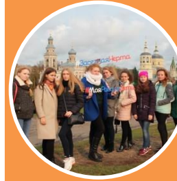
Путешествие на поезде

Выбор зависит от предпочтений и возможностей конкретной группы школьников