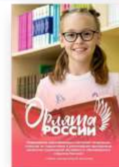
КУРСЫ ПОВЫШЕНИЯ КВАЛИФИКАЦИИ ДЛЯ УЧИТЕЛЕЙ НАЧАЛЬНЫХ КЛАССОВ