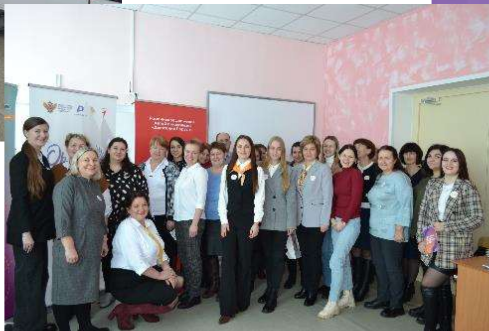
Починковский, Монастырщинский, Хиславичский, Ельнинский, Глинковский район