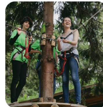
«ПОХОДЫ ПЕРВЫХ- БОЛЬШЕ, ЧЕМ ПУТЕШЕСТВИЕ»