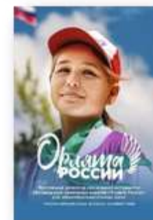
ПРОГРАММА ВНЕУРОЧНОЙ ДЕЯТЕЛЬНОСТИ