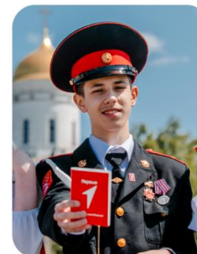
«МЫ – ГРАЖДАНЕ РОССИИ!»