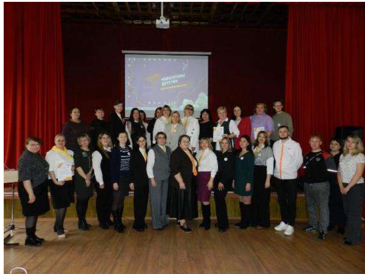
Сафоновский, Дорогобужский, Холм-Жирковский районы