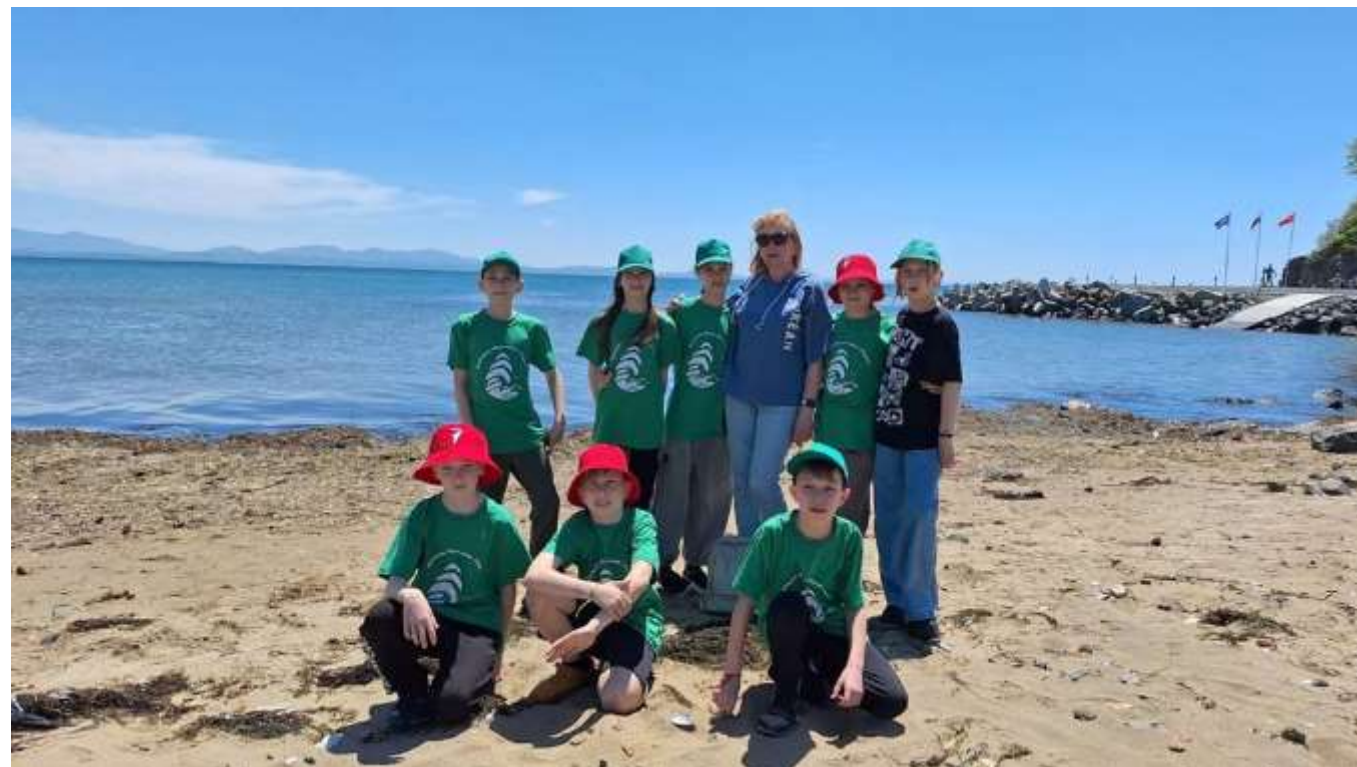
Команда-победитель ВДЦ «Океан», май 2024