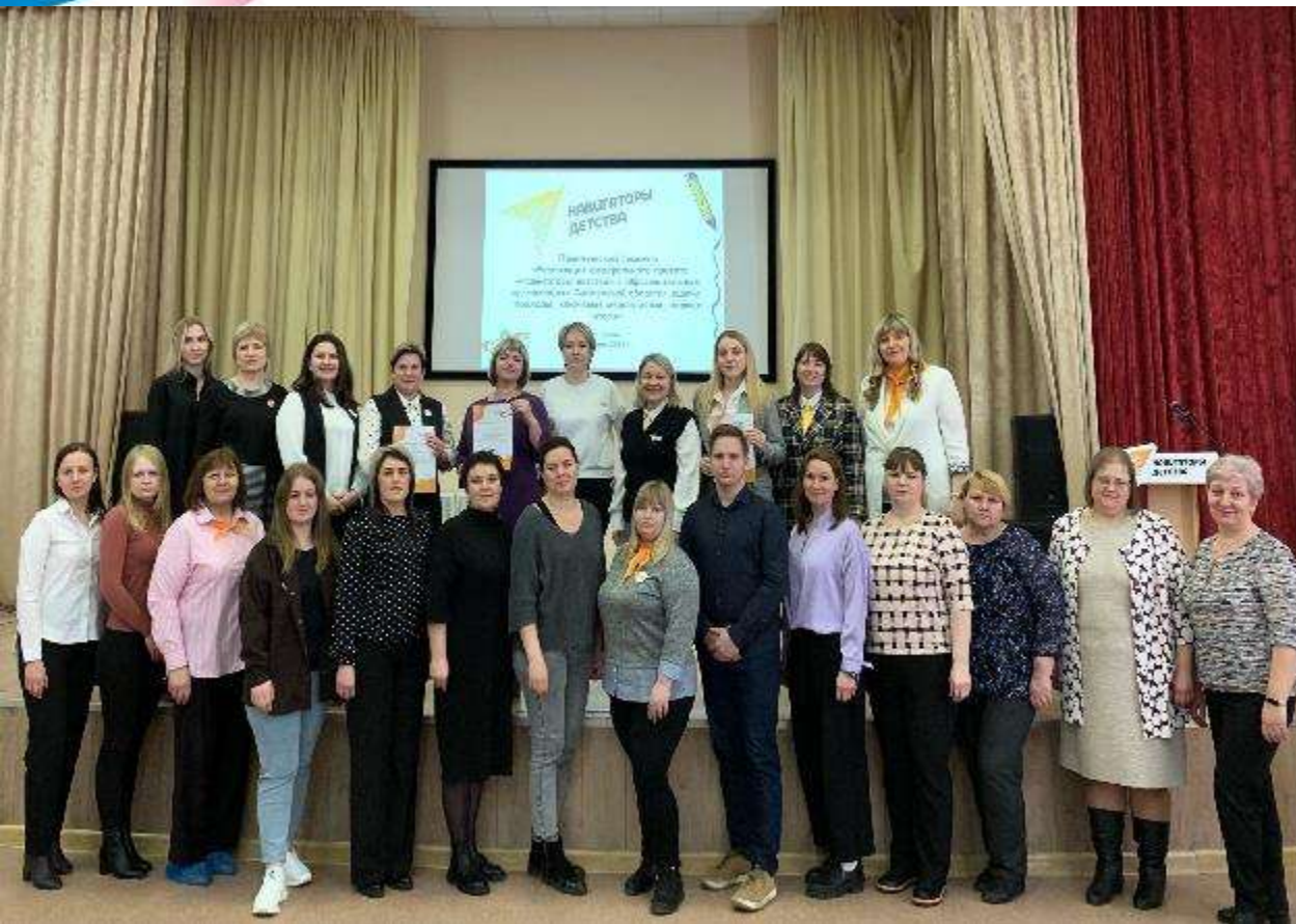
Велижский, Краснинский, Руднянский районы