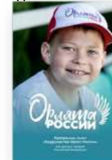
ПРОГРАММЫ СМЕН «СОДРУЖЕСТВО ОРЛЯТ РОССИИ»