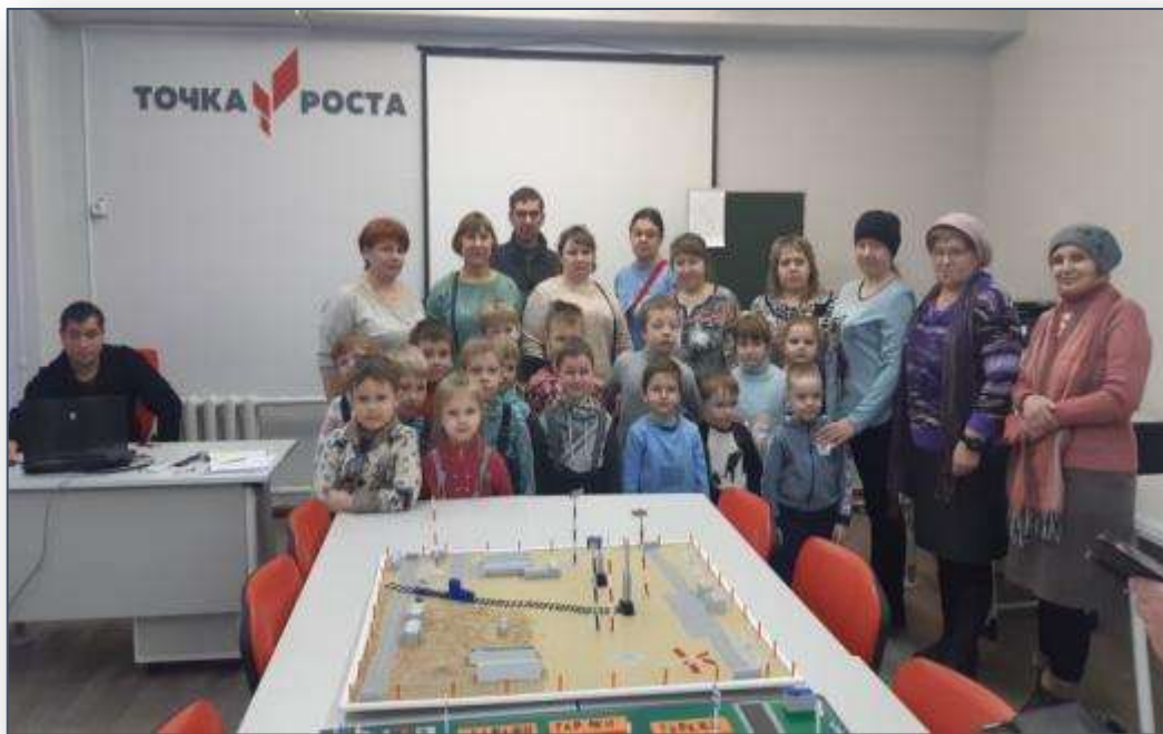
«Точка роста» на базе МБОУ СОШ №9