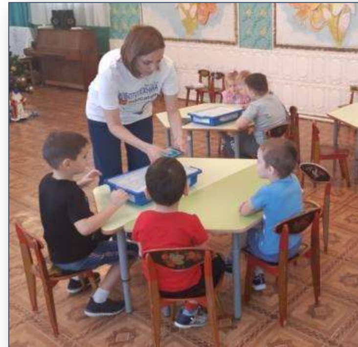
Детский развивающий центр «Наши детки»