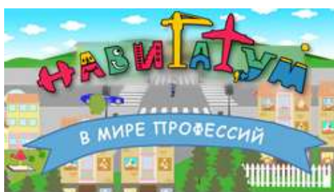
В МИРЕ ПРОФЕССИЙ мультсериал для дошкольников