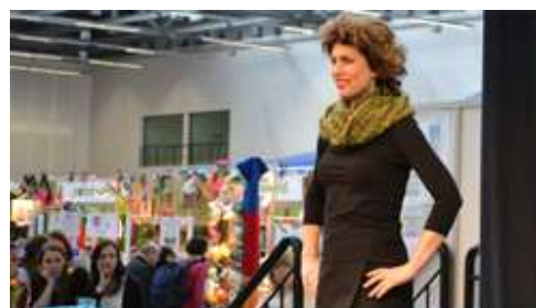
ЛАЙФХАК ПО ТРУДОУСТРОЙСТВУ фильм для соискателей