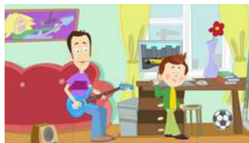
КАЛЕЙДОСКОП ПРОФЕССИЙ для школьников всех классов