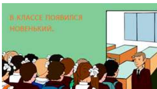
ПРОФИОРИЕНТАЦИОННЫЙ ТЕСТ для школьников средних и старших классов