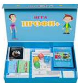
ИГРА «ПРОФИ ПЛЮС» решение для профориентации школьников