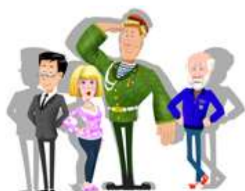
БРАТСТВО ТРУДА профориентация взрослых