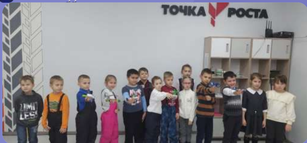
Школа «Точка Роста»