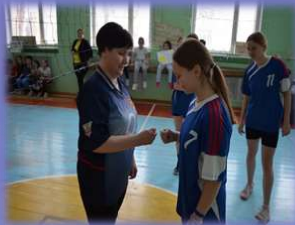
Социальный аниматор – учитель, родитель