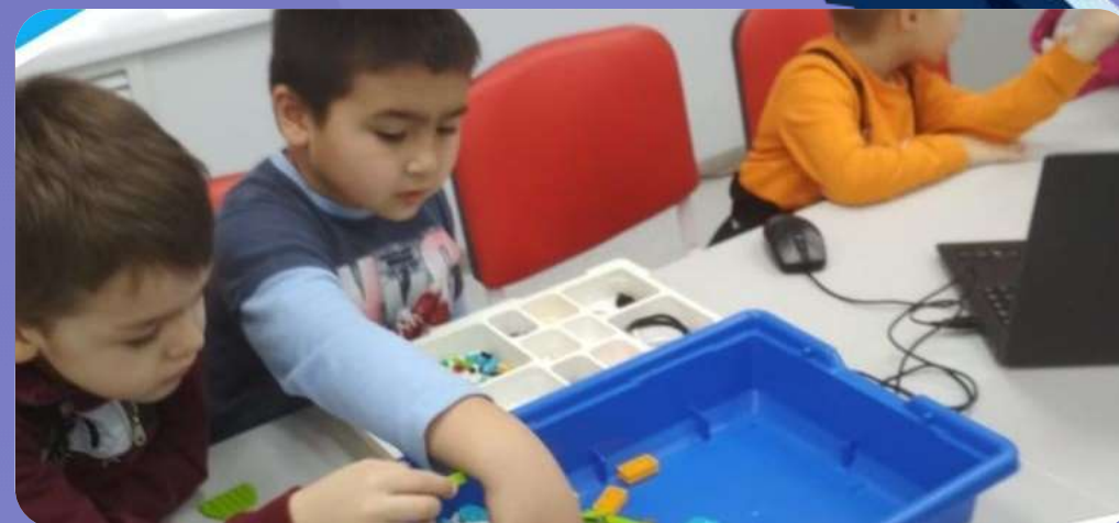
Школа «Точка Роста»