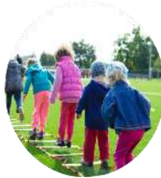
Центры психолого-медико-социального сопровождения