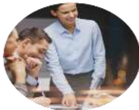
Образовательные организации, реализующие адаптированные ОП