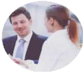
Бюро медико-социальной экспертизы