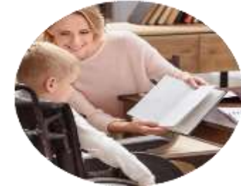
Организации социальной защиты