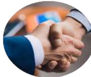
Научные организации, обеспечивающие теоретическую, методологическую, экспертную функции