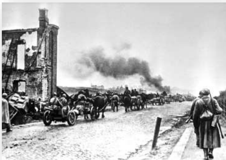
Советские войска вступают в Ельню в сентябре 1941 года