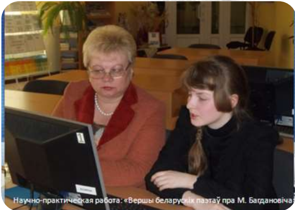
Научно-практическая работа: «Вершы беларускіх паэзаў пра М. Багдановіча»

Получили признание бинарные уроки на базе читального зала по таким предметам, как русская и белорусская литература, история, география. Библиотекарю отводится задача создания условий проведения урока: хороший справочно-поисковый аппарат (каталоги, картотеки), подготовка выставки по теме урока. Успешно проводимые совместно с педагогами бинарные уроки способствуют также продвижению библиотечных знаний и умений, ориентированных на развитие меж предметных связей.