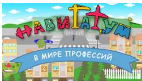
В МИРЕ ПРОФЕССИЙ мультсериал для дошкольников