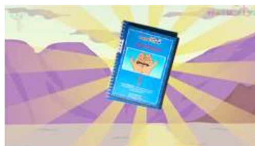
ВИДЕО ПРИТЧИ И УПРАЖНЕНИЯ психологическая поддержка и мотивация

Некоторые профориентационные мероприятия можно проводить в разной форме в зависимости от поставленной цели и возрастных особенностей учащихся.