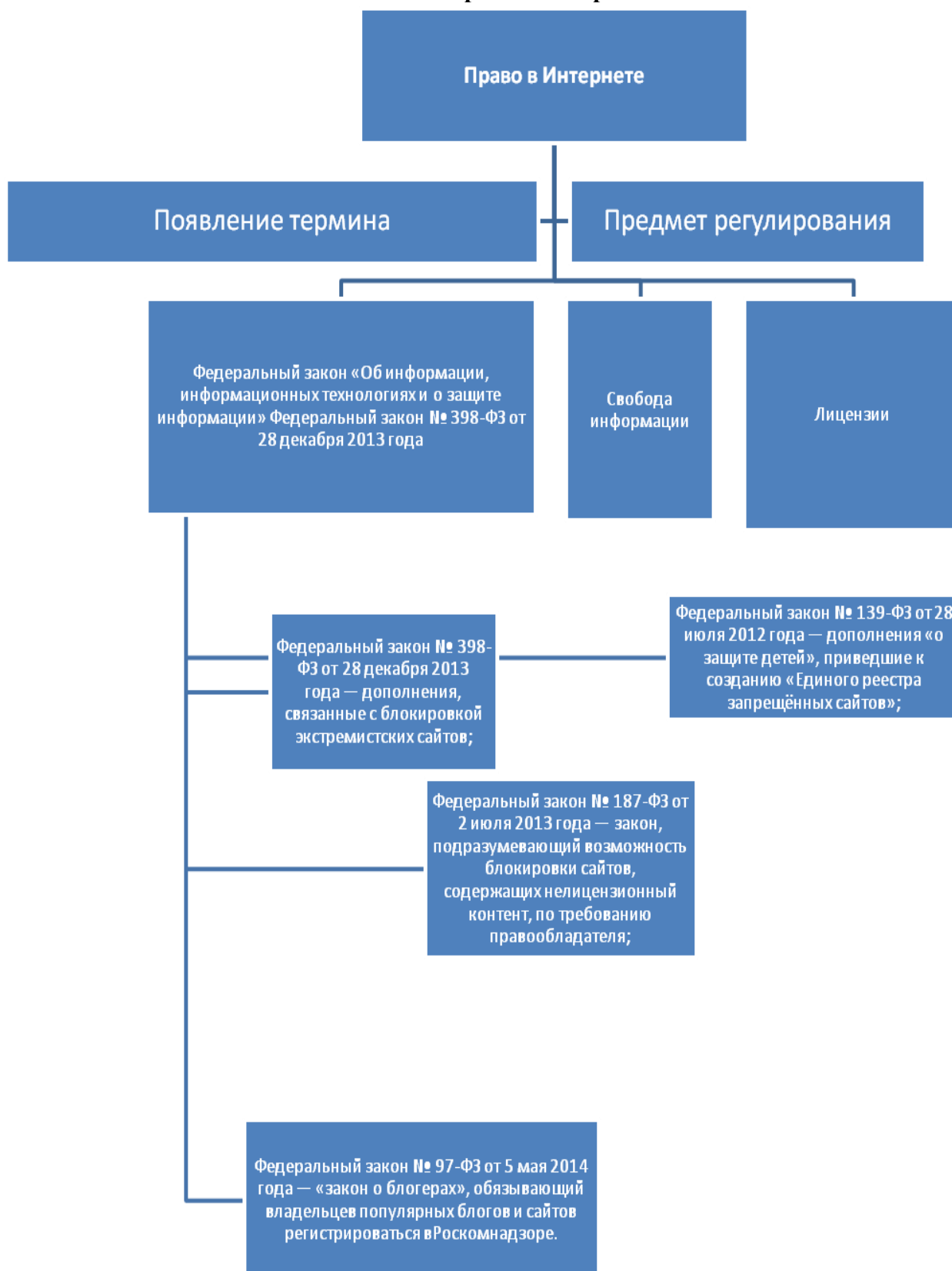
Схема 1. Право в интернете