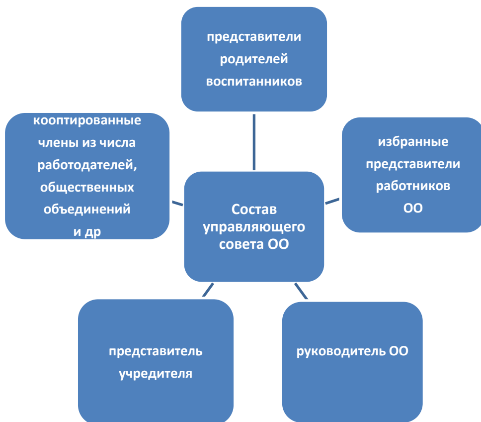
Рис. 2 – Состав управляющего совета ОО

некоммерческих организаций, заинтересованных в функционировании и развитии образовательной организации [22].