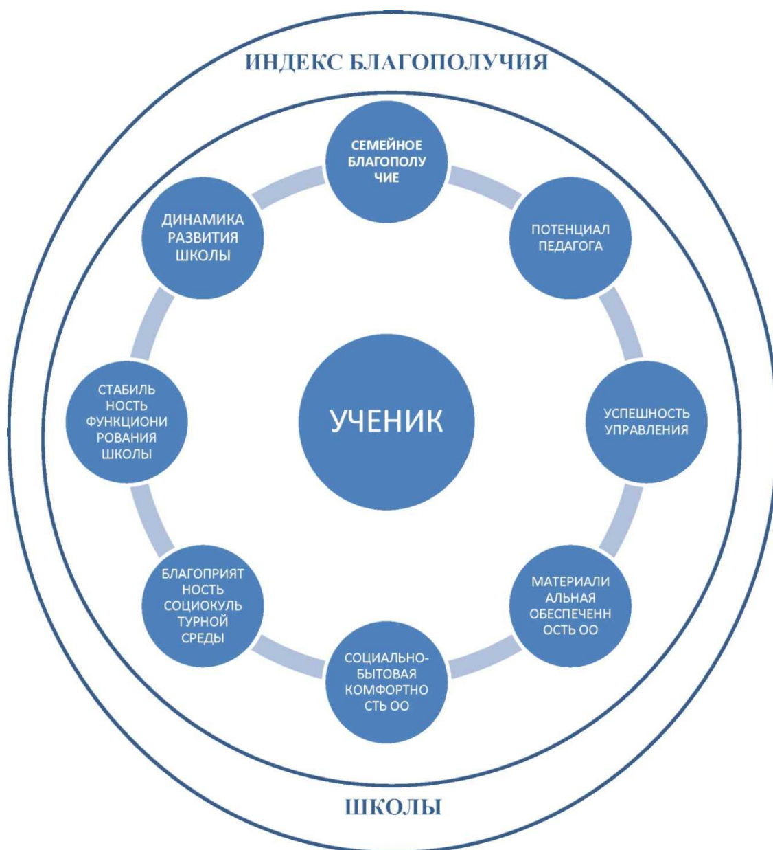
Схема 1. Компоненты школьной среды, влияющие на успешность ученика

Степень соответствия среднего балла интеллектуальному потенциалу обучающегося зависит от компонентов, составляющих образовательную деятельность школы (схема 1):