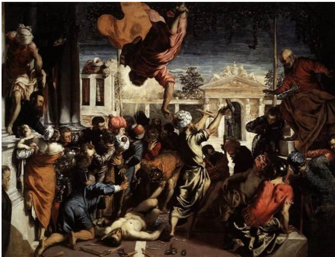
«Чудо св. Марка»