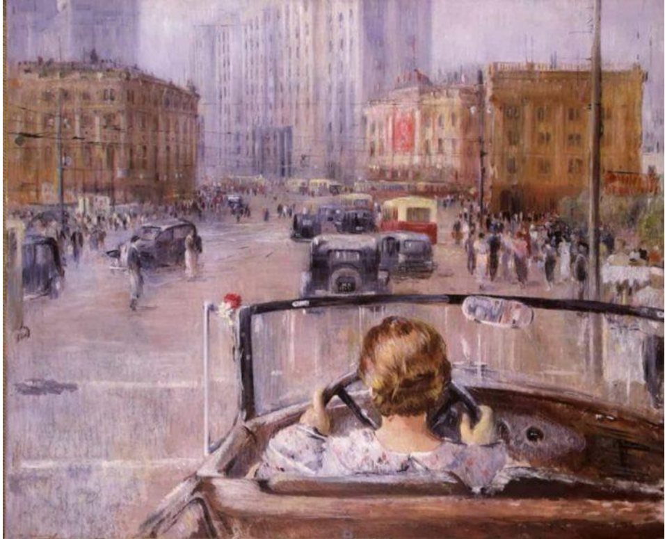
Новая Москва, 1937 год