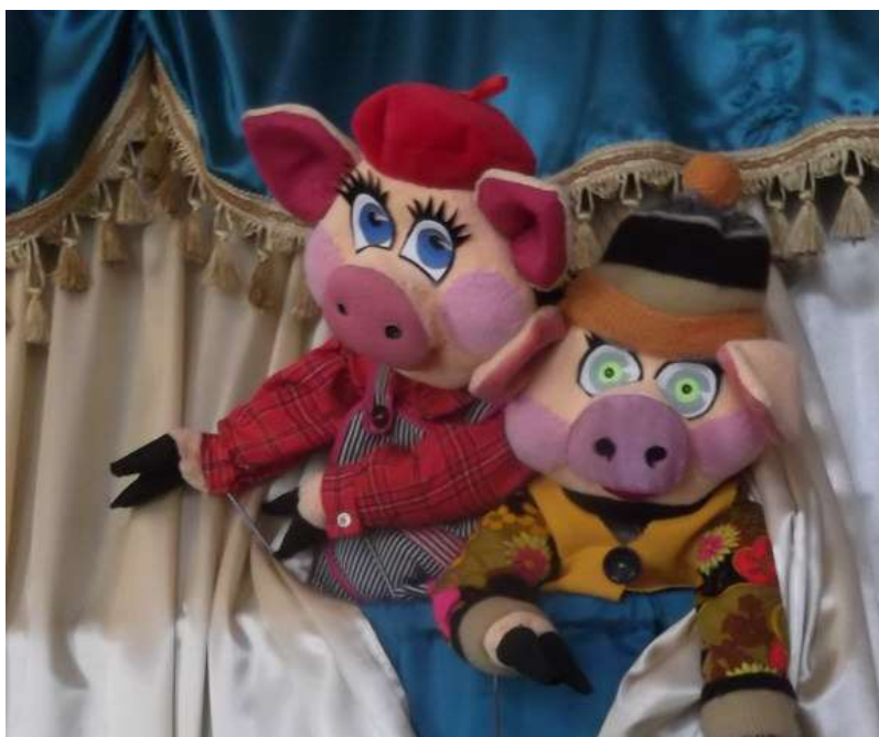
«Южачей» 2014 г.