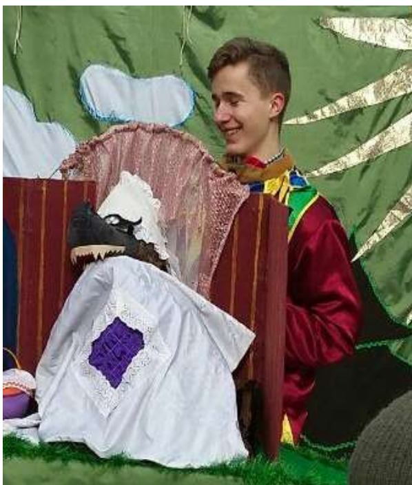
Показ интерактивного кукольного спектакля