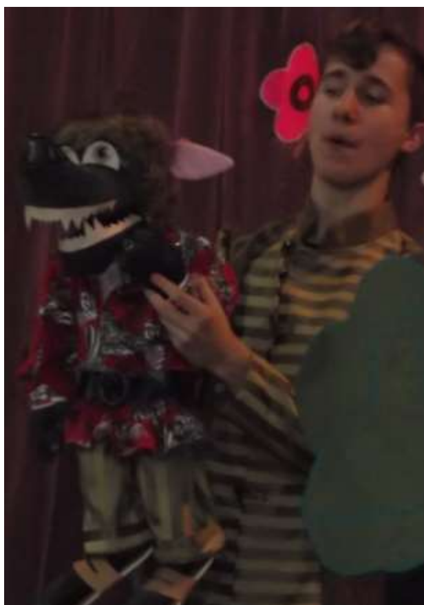
На летней площадке и в детском саду