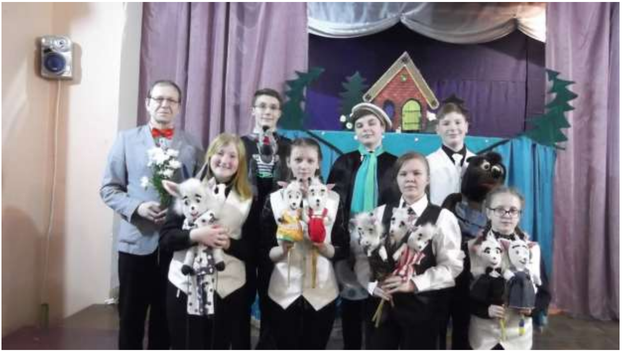
Участники кукольного спектакля «Волк и 7 козлят» 2013 год