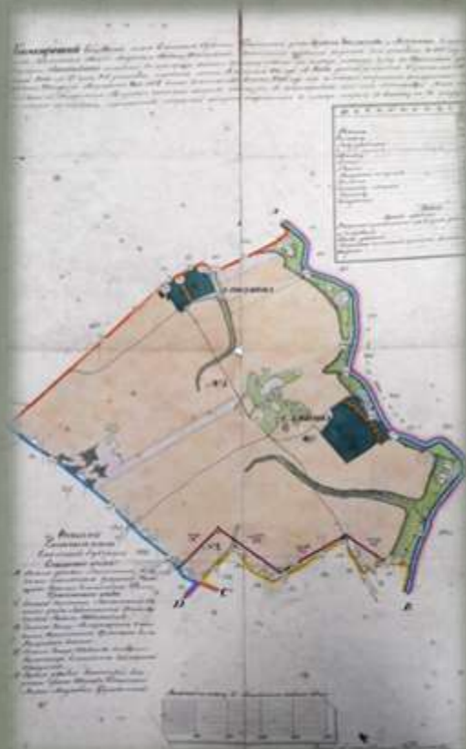
Геометрический специальный план Смоленской губернии Краснинского уезда деревень Бокланова и Алексина