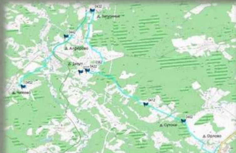
Маршрут учебно-тренировочного похода