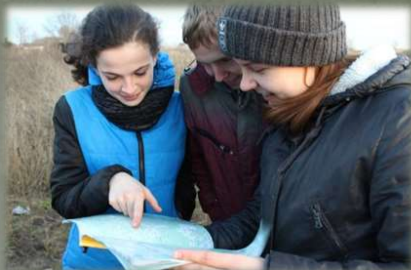
Экспедиционный отряд в д. Горня