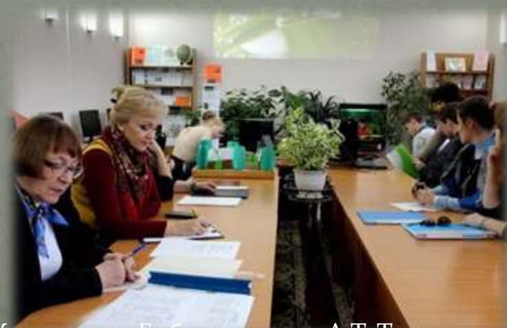
Жюри слета. Библиотека им. А.Т. Твардовского