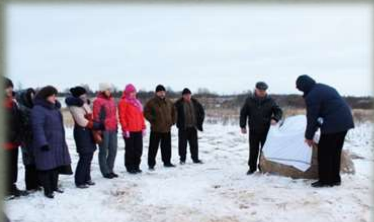
Торжественное открытие памятного знака в д. Буловицы.