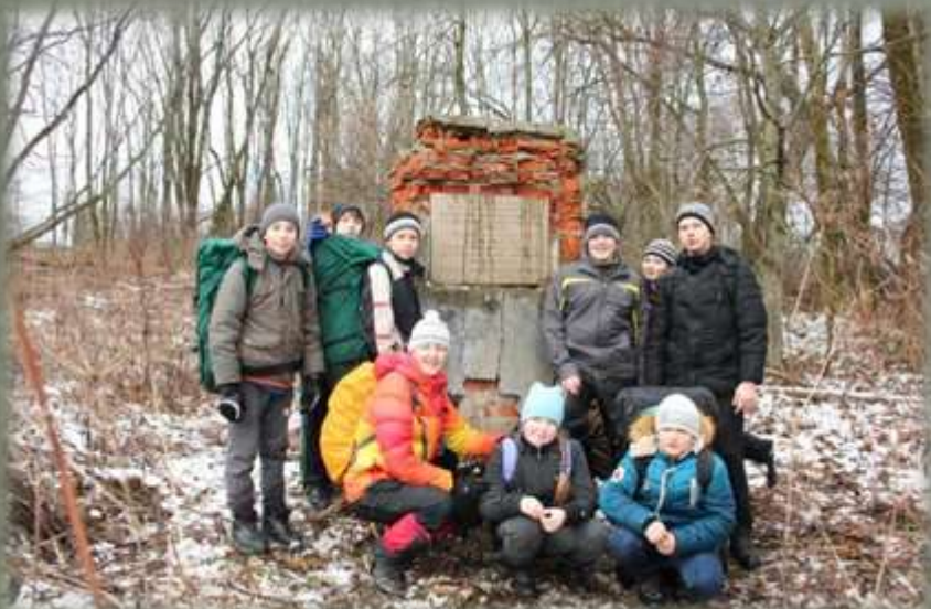
Памятный знак поставлен в д. Васильево в 1974 году