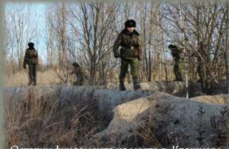
Остатки фундамента на месте д. Крашнево.