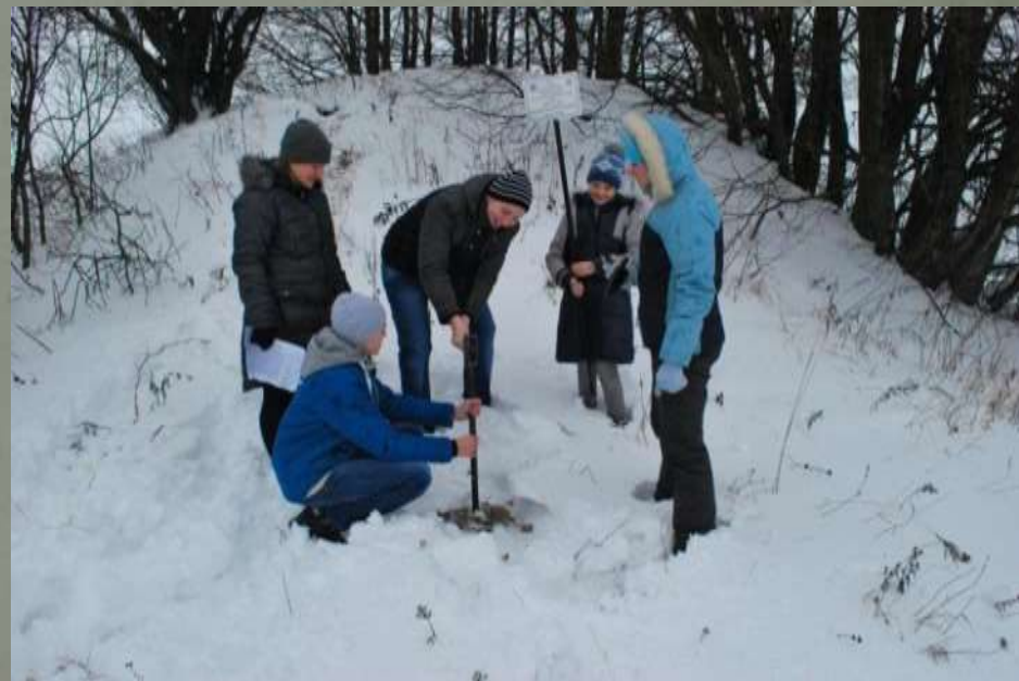
Установка памятной таблички в д. Смоляничи.