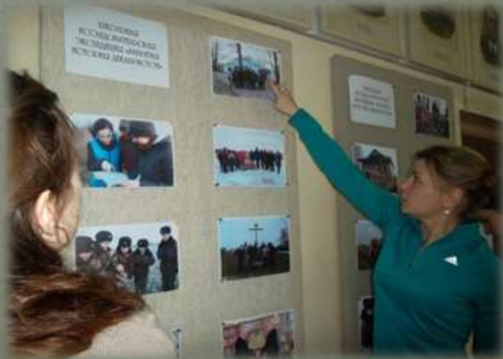
Научно-практическая конференция «Товарищ, верь!»