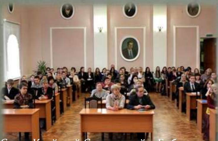
Слет «Край мой Смоленский». Библиотека им. А.Т. Твардовского.