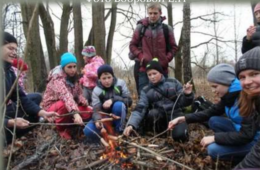
Экспедиционный отряд в д. Горня