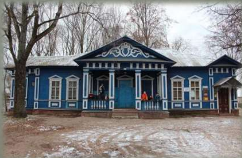
Дом П.Г. Каховского в д. Жуково