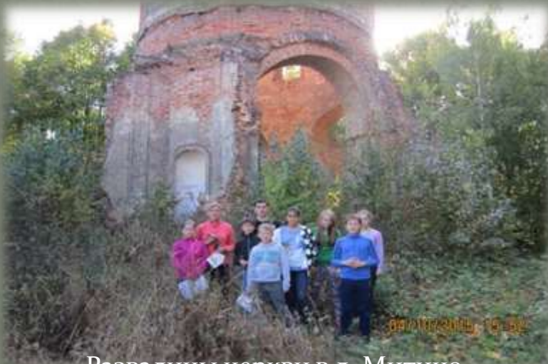
Развалины церкви в д. Митино.

2. исследовательские выезды на местность и однодневные пешие походы обучающихся творческих объединений СОГБОУДОД «Детско-юношеский центр туризма, краеведения и спорта» в октябре-декабре 2015 года: