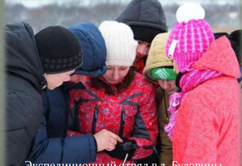
Экспедиционный отряд в д. Буловицы