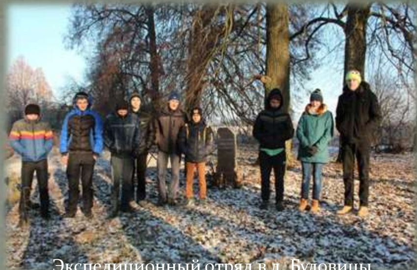
Экспедиционный отряд в д. Буловицы