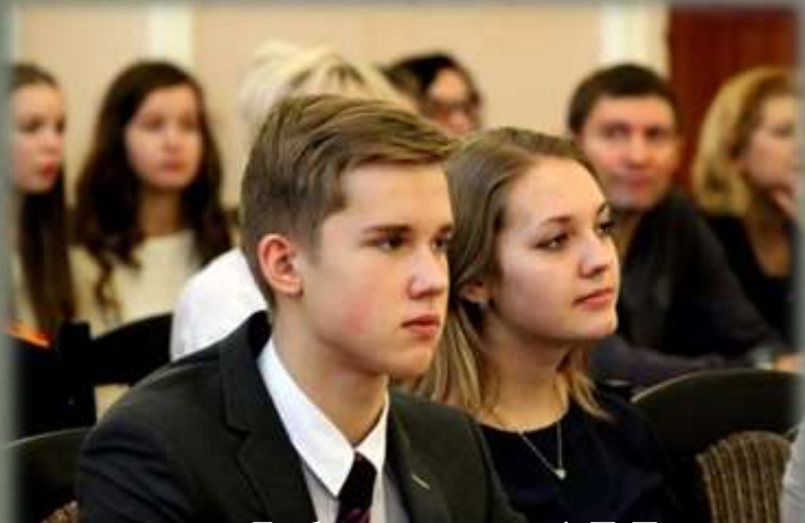
Участники слета. Библиотека им. А.Т. Твардовского

Проведен областной слет Смоленской области по школьному краеведению «Край мой Смоленский», посвященного 190-летию восстания декабристов» на базе ГБУК «Смоленская областная универсальная библиотека им. А.Т. Твардовского» (ноябрь 2015 года), общим количеством участников – 199 человек.