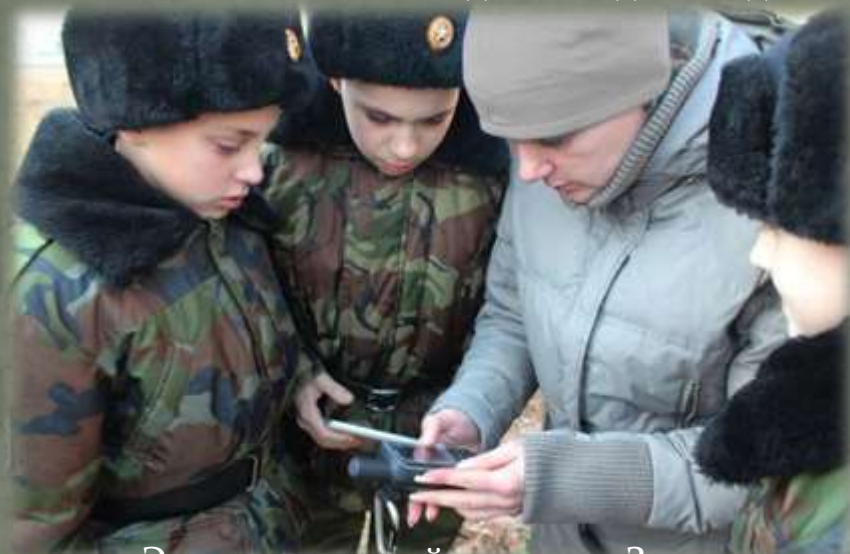
Экспедиционный отряд в д. Закуп

В процессе исследований наносились координаты населенных пунктов, в том числе и уже несуществующих, подъездные дороги (маршруты) к ним. Опрашивались местные жители, описывалась местность, где некогда находились усадьбы декабристов, и сохранившиеся объекты.