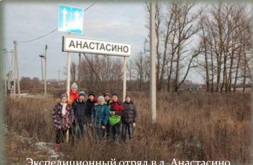
Экспедиционный отряд в д. Анастасино

В проведении полевых исследований приняло участие: 1. из числа обучающихся СОГБОУДОД «Детско-юношеский центр туризма, краеведения и спорта» - 85 человек; 2. из числа обучающихся краеведческих кружков образовательных организаций (школ), расположенных вблизи изучаемых объектов - 31 человек.