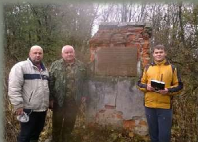
Участники экспедиции в д. Васильево