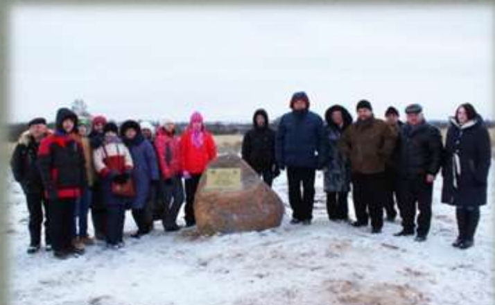
Торжественное открытие памятного знака в д. Буловицы.