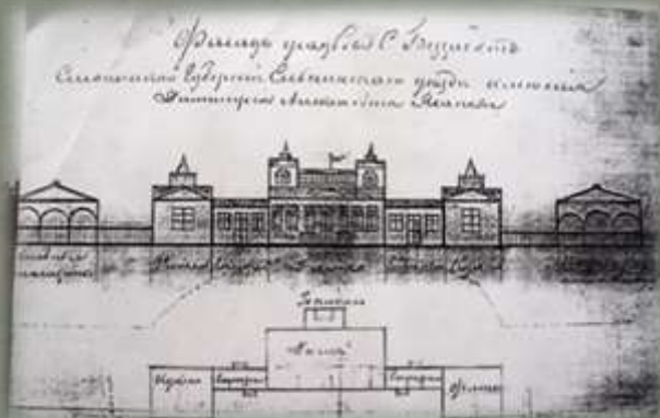
Фасад усадьбы в д. Беззаботы