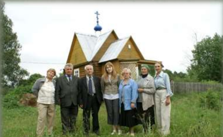
Краеведы и местные жители в д. Новояковлевичи

1. предварительные исследовательские выезды на местность экспедиционными группами местных краеведческих кружков в августе-октябре 2015 года (при участии местных жителей по необходимости):