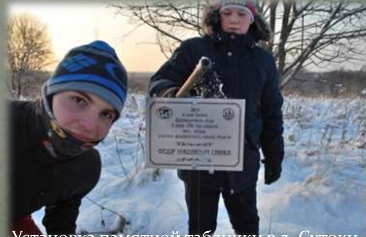
Установка памятной таблички в д. Сутоки.