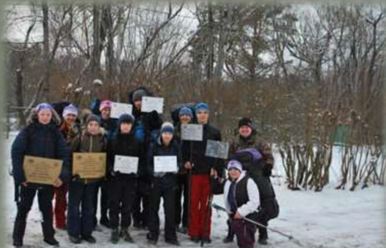
Участники экспедиции с памятными табличками

1. В целях разработки познавательного краеведческого пешеходного маршрута и установки памятных табличек был проведен учебно-тренировочный поход в Духовщинский район Смоленской области. В походе приняли участие 14 человек