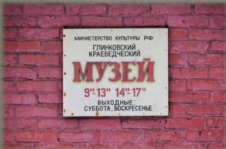
Глинковский краеведческий музей.

Также табличка, посвященная Вильгельму Карловичу Кюхельбекеру, была передана администрации Духовщинского краеведческого музея.