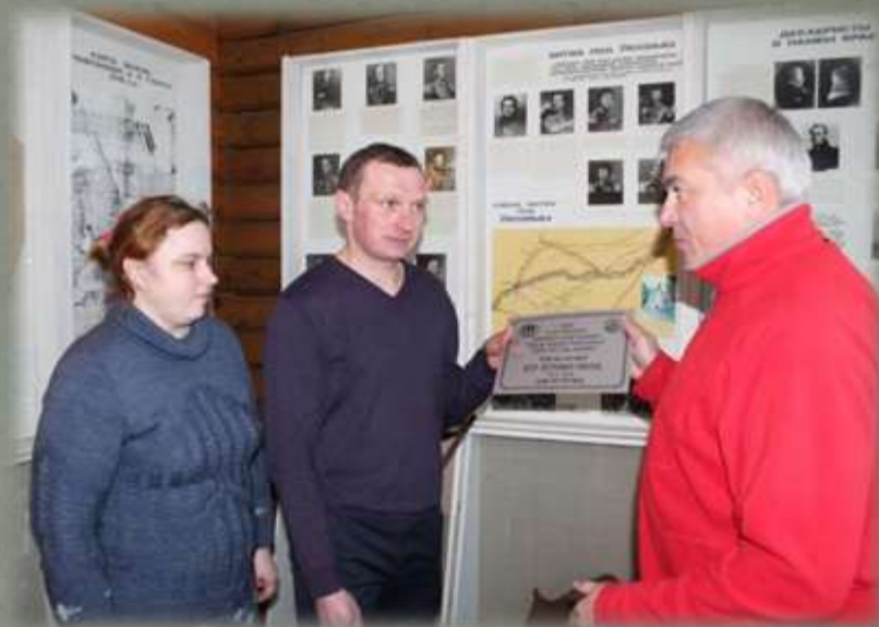
Торжественная передача таблички в Глинковском краеведческом музее.