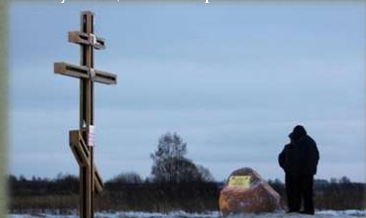
Памятный знак в д. Буловицы.