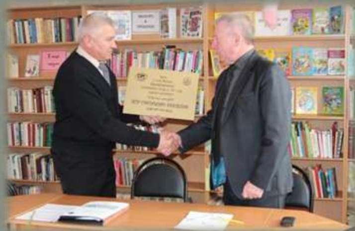
Торжественная передача памятной таблички.