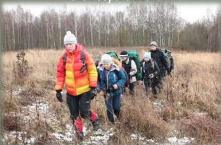
Экспедиционный отряд в Монастырщинском районе