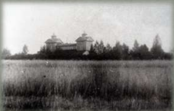
Фотография усадьбы в д. Беззаботы начала XX века