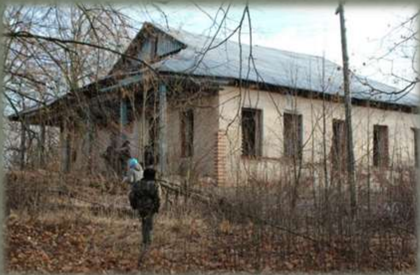
Остатки усадьбы Пассека в д. Беззаботы