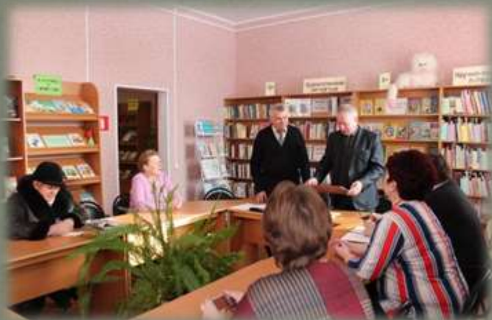
Торжественная передача памятной таблички.

3. Установка памятных табличек согласовывалась с главами администраций и местными краеведческими музеями. Была достигнута договоренность о том, что таблички будут установлены силами местных администраций. Так, например, в январе 2016 года состоялась торжественная передача таблички, посвященной Петру Григорьевичу Каховскому, администрации Смоленского района. Она будет закреплена на огромном камне, который будет установлен в с. Митино весной 2016 года.