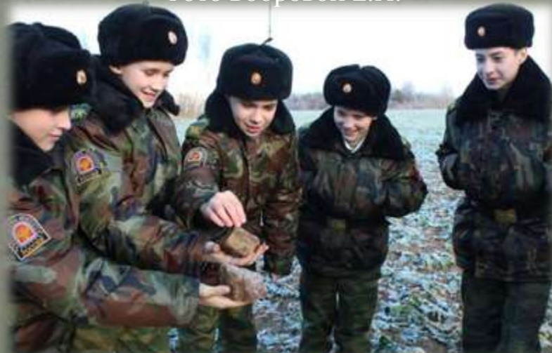
Фрагменты кирпичей на месте д. Крашнево