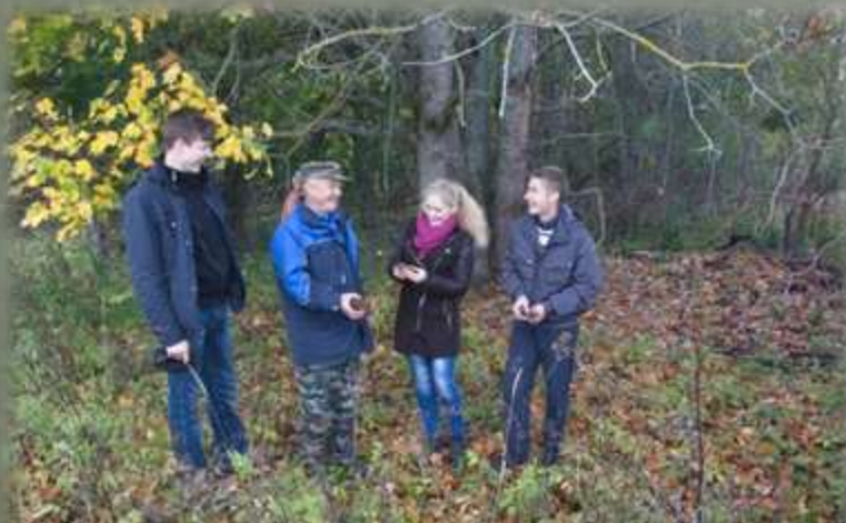
Участники экспедиции и старожилы в д. Буловицы