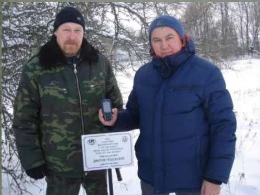
Установка памятной таблички в д. Горня.

5. Памятные знаки были установлены силами сотрудников и обучающихся СОГБОУДОД «Детско-юношеский центр туризма, краеведения и спорта» в ныне несуществующей деревне Горня Дорогобужского района декабристу Грохольскому Дмитрию и в ныне несуществующей деревне Смоляничи Монастырщинского района декабристу Александру Михайловичу Каховскому.