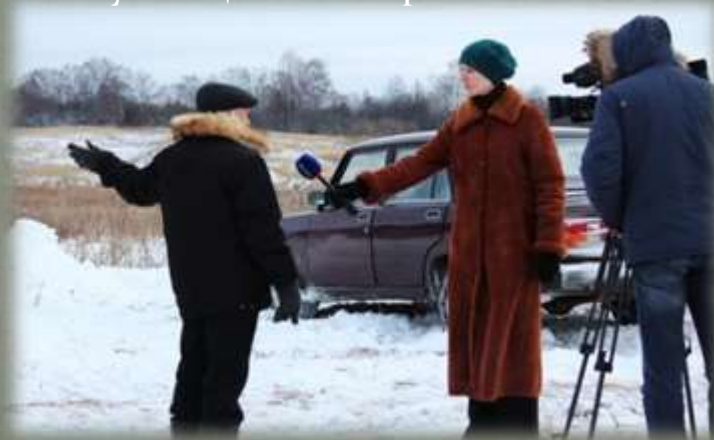
Местный житель дает интервью Смоленскому телевидению.