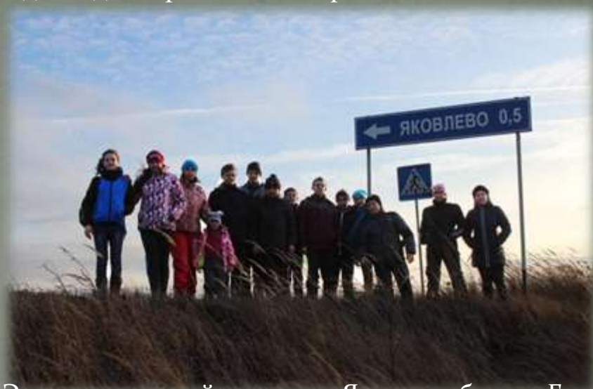
Экспедиционный отряд в д. Яковлево близ д. Горня