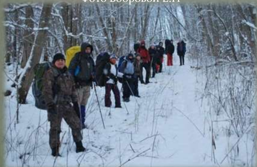
Экспедиционный отряд в Духовщинском районе.