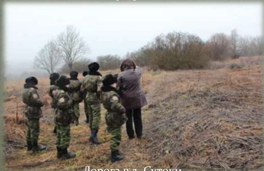
Дорога в д. Сутоки.