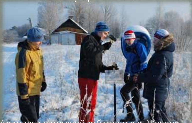
Установка памятной таблички в д. Жуково Сафоновского района.