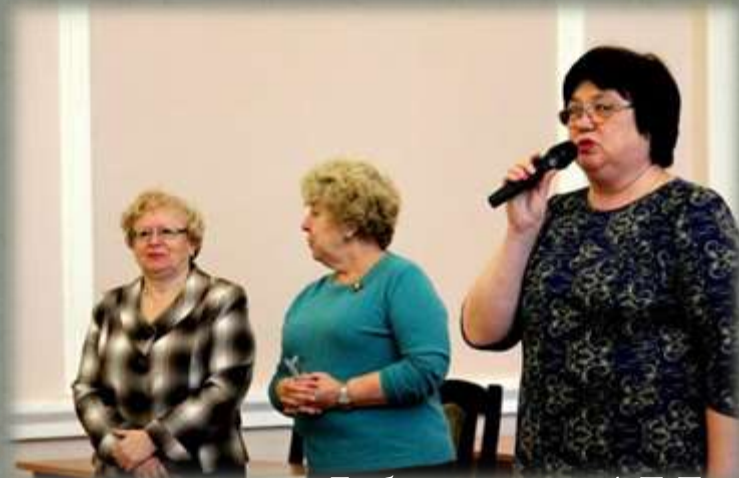
Организаторы слета. Библиотека им. А.Т. Твардовского