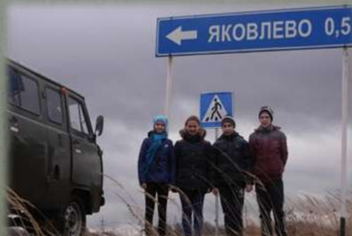
Участники экспедиции в д. Яковлево близ д. Горня