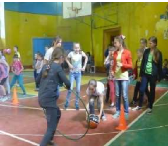
К олимпийским вершинам.