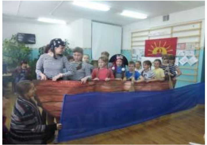
Знакомство с отрядами.