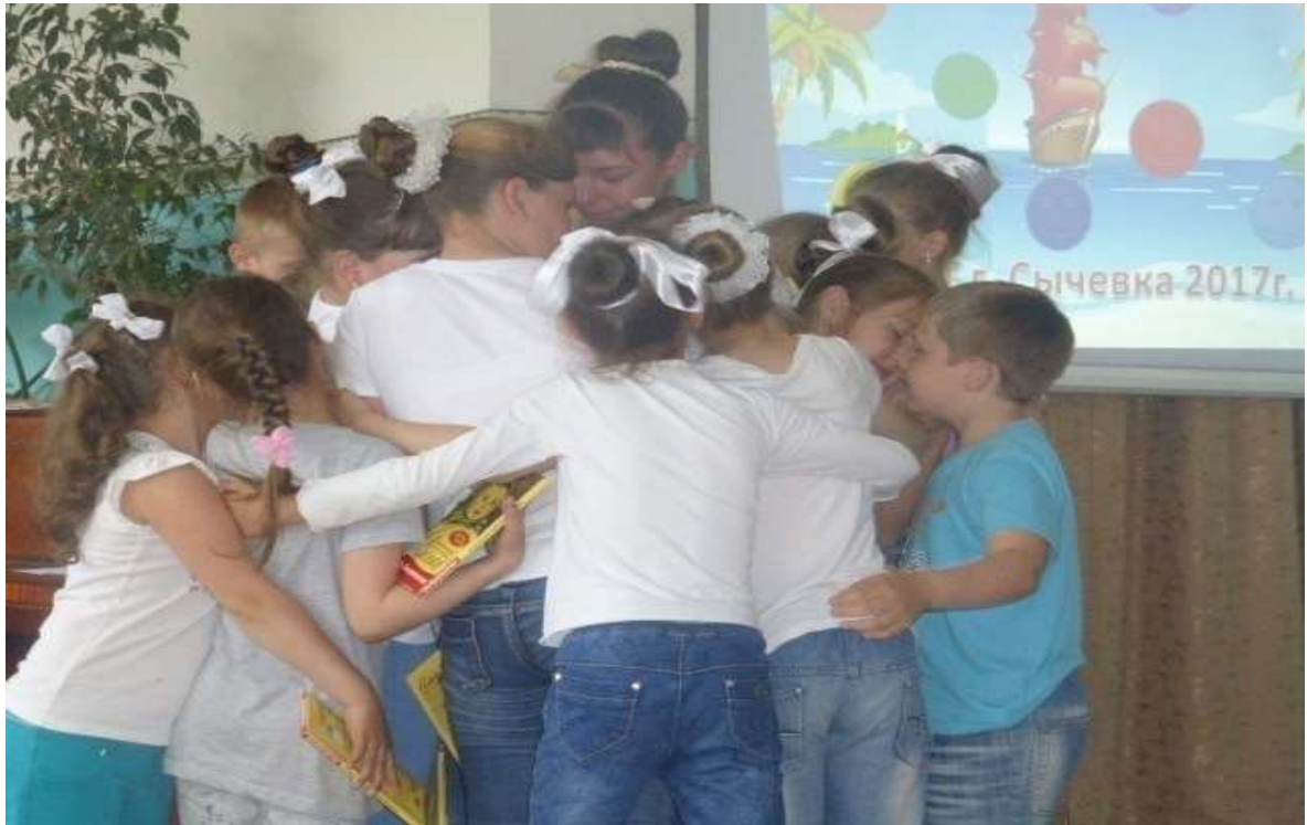
Закрытие лагеря (реальные слёзы).