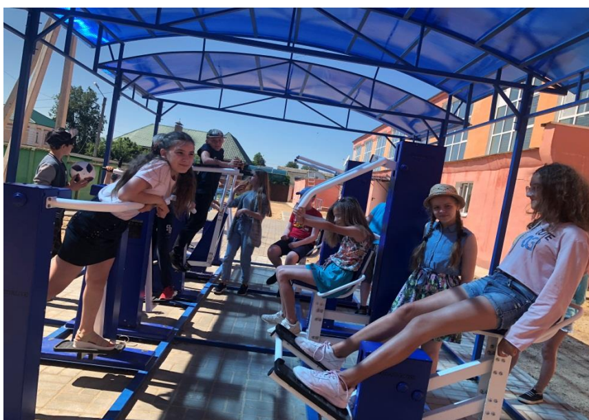
Игры на свежем воздухе. Занятия на тренажерах.