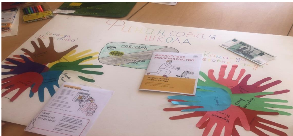
Оформляем уголок отряда.