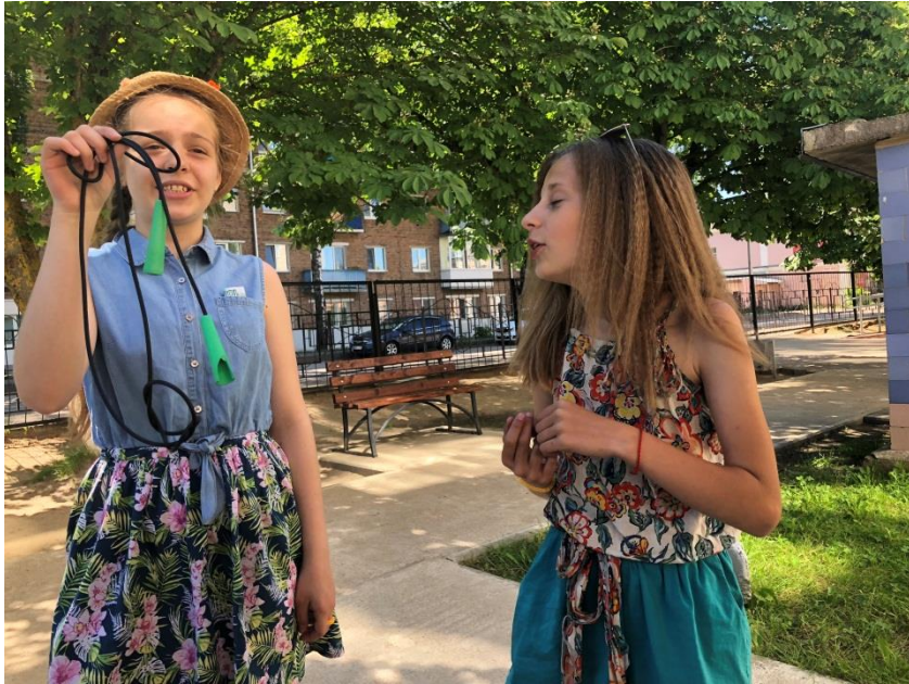
«Малые олимпийские игры»