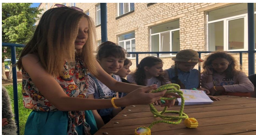
Команда «Монеточка» Наш девиз «Каждый - монеточка, вместе мы – клад!»