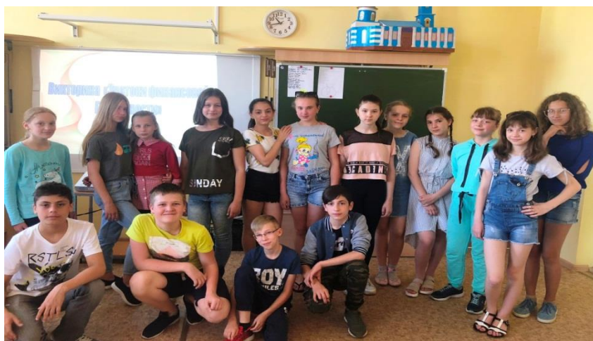
Наш профильный отряд «Финансовая школа»