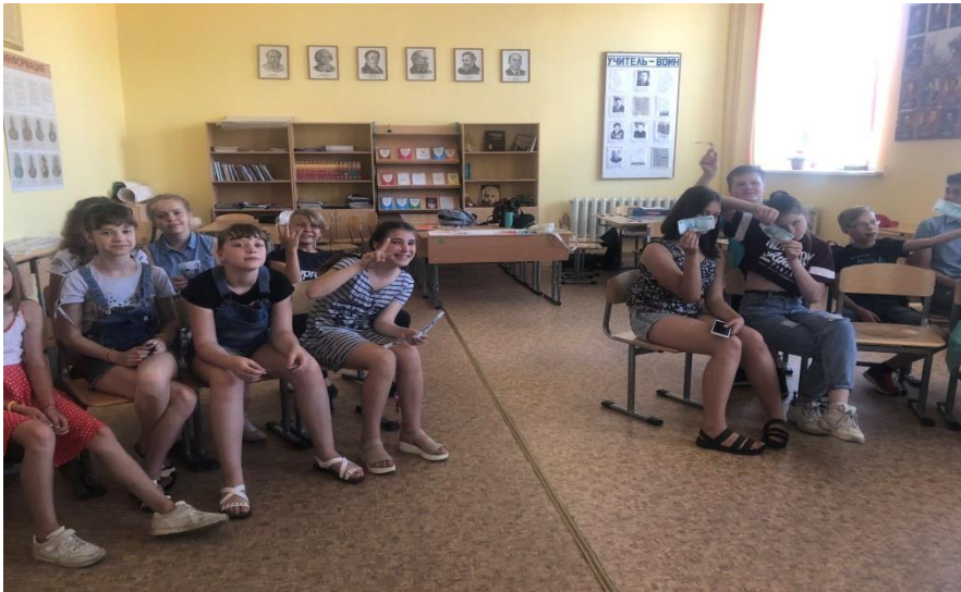
Занятие в Финансовой школе . Интеллектуальное шоу