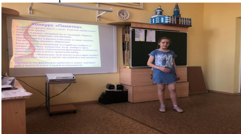
Занятия в «Финансовой школе» Идет деловая игра