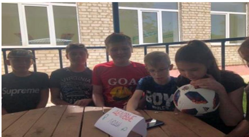
Команда «Деловые люди» Наш девиз : «Понять давно уже пора: основа бизнеса – игра!»