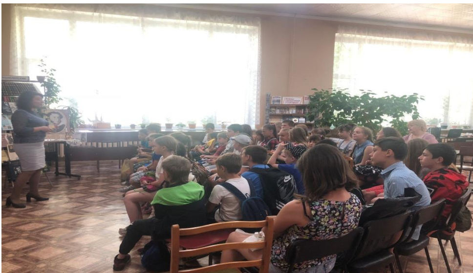
День Пушкина. В районной библиотеке викторина по сказкам А.С.Пушкина