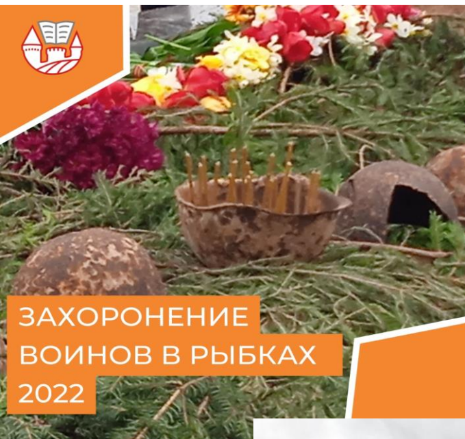
ЗАХОРОНЕНИЕ ВОИНОВ В РЫБКАХ 2022