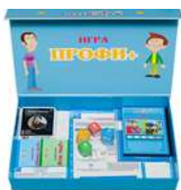
ИГРА «ПРОФИ ПЛЮС» решение для профориентации школьников