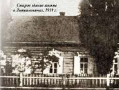
Старые здания школы в Ленинском районе ИОА.