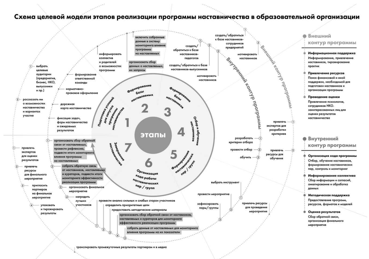
Рис. 1. Схема целевой модели этапов реализации программы в образовательной организации

Содержание каждого этапа, представленное в виде направлений работы с внутренним и внешним контурами, содержится в таблице 1 «Целевая модель этапов реализации программы наставничества в образовательной организации».