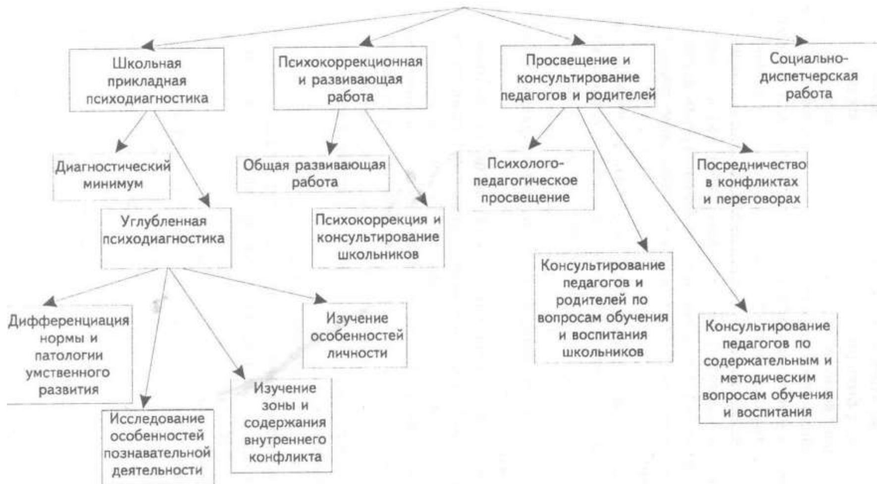
Схема 2. Основные направления деятельности психологической службы