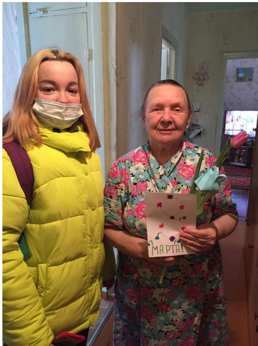
Акция «Вам, любимые»