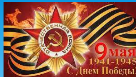
Карточка «Основные события Великой Отечественной войны»