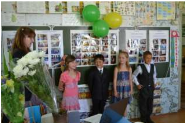
Праздник Последнего звонка (фотогазеты по предметам)