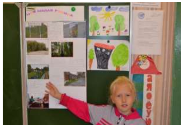
Всероссийский урок «Я – гражданин!» (творческий проект «Моя малая родина»)