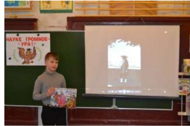
Летнее путешествие в Санкт-Петербург