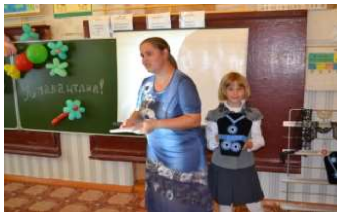
Всероссийский урок «Я талантлив!»