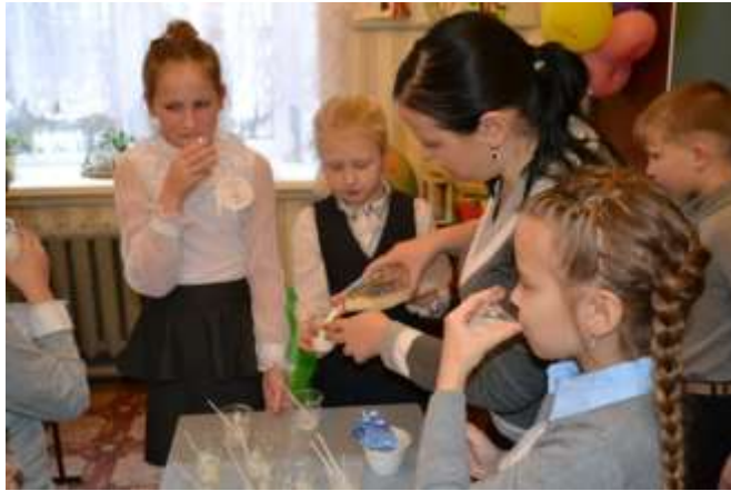
Почему молоко скисает?

Исследовательские и творческие семейные проекты