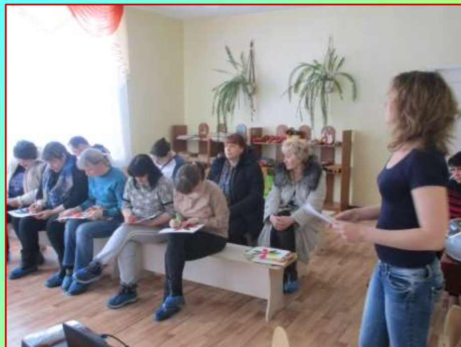
Родительское собрание в старшей группе «Воспитание добротой»