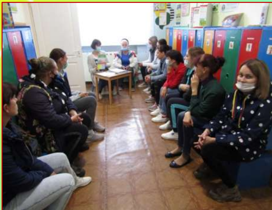
Родительское собрание в подготовительной к школе группе «Развитие добрых чувств у ребёнка»

Родительские собрания: Посредством собраний координируются действия родительской общественности и педагогического коллектива по вопросам обучения, воспитания, оздоровления и развития детей.