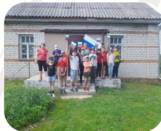
Сельская библиотека №5