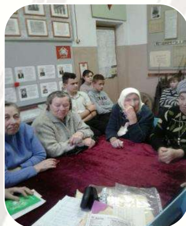
Школьный краеведческий музей