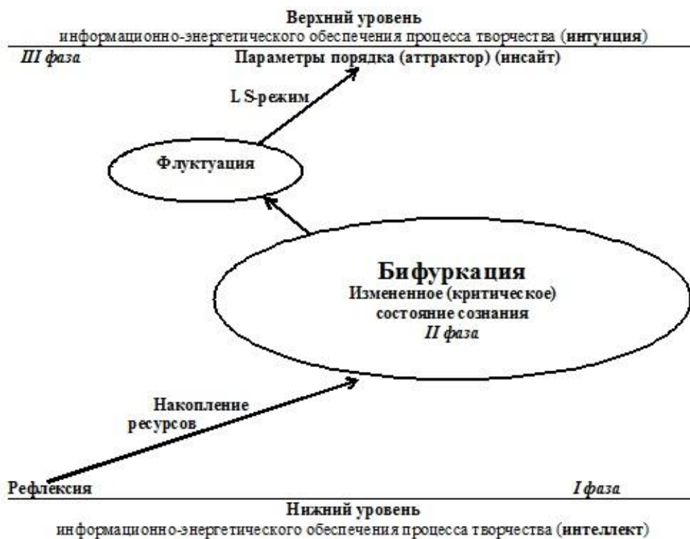
Рис. 1. Информационно-энергетическая модель творчества

Синергетический принцип иерархичности [1] помогает понять, что параметры порядка всегда находятся на вышележащем уровне по отношению к рассматриваемому (интеллект), поэтому порядок не может сложиться в первой, логической фазе творчества из-за нехватки информационно-энергетических ресурсов. Первая фаза в синергетике рассматривается как начало инициирования хаотических процессов, как фаза накопления энергоинформационных ресурсов.