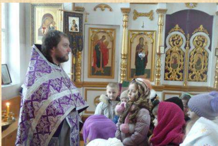
Экскурсия в храм