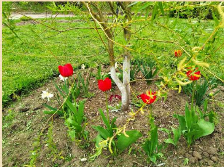
Акция «Цветущий город»