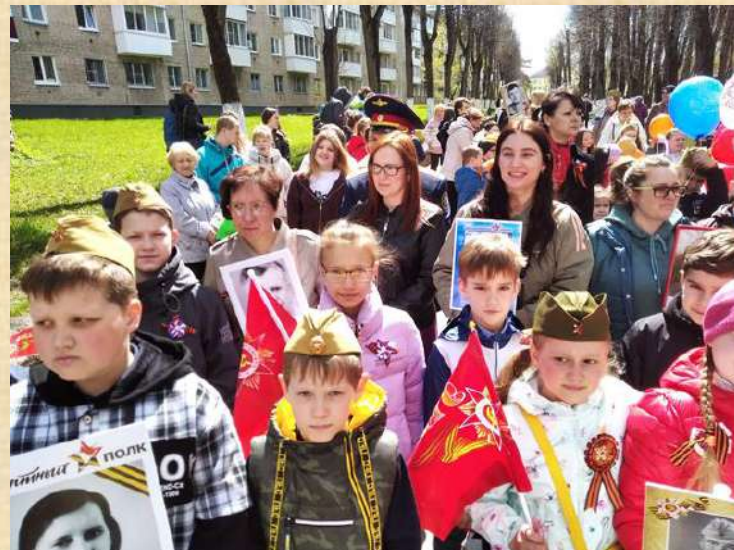
Акция «Бессмертный полк»