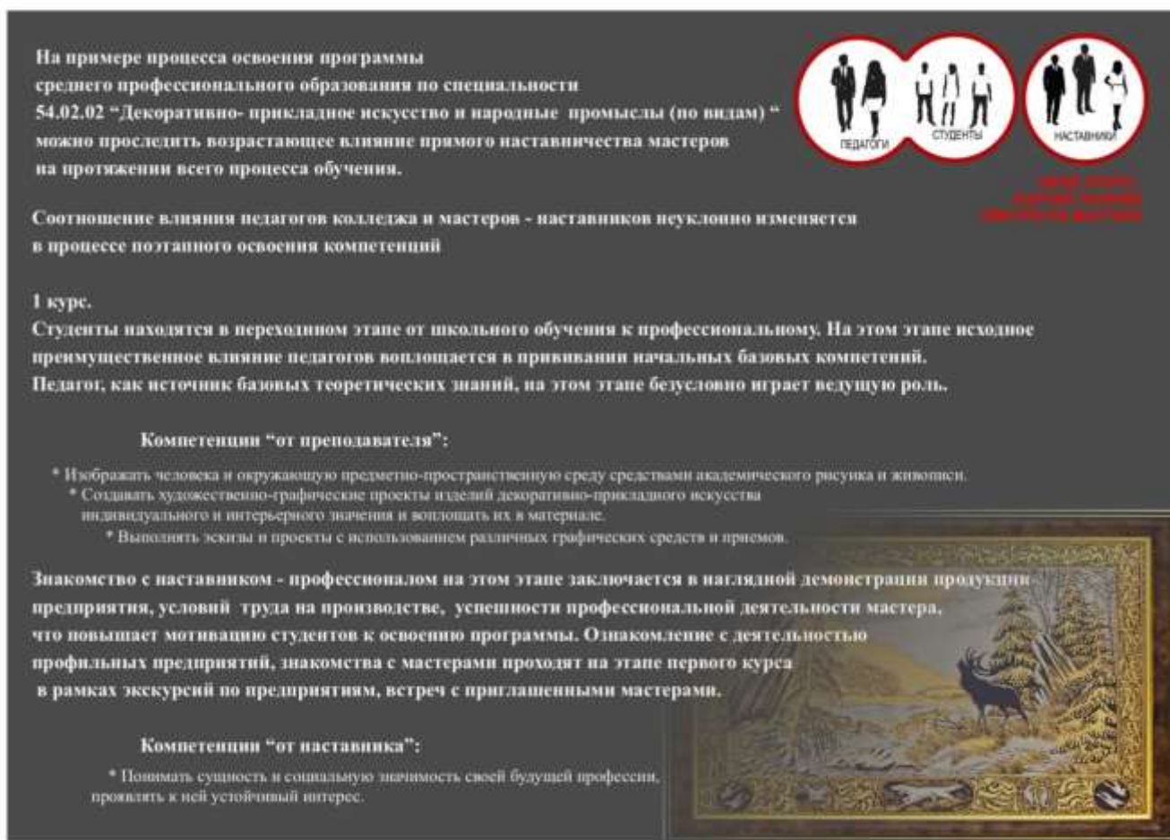
Рис.2 Процесс профессиональной подготовки на 1 курсе обучения.

2 курс. В процессе прохождения образовательной программы второго курса студенты создают свои первые серьезные творческие работы, в процессе изготовления которых выявляют свои сильные и слабые стороны, определяют наиболее интересные для них участки производственной деятельности. На данном этапе педагог условно передает ведущую роль мастеру - наставнику. В дальнейшем педагог осуществляет поддерживающую функцию.