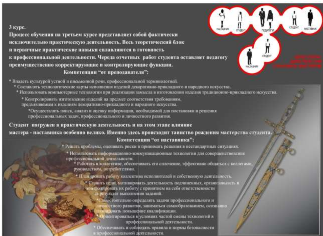
Рис.4 Процесс профессиональной подготовки на 3 курсе обучения.