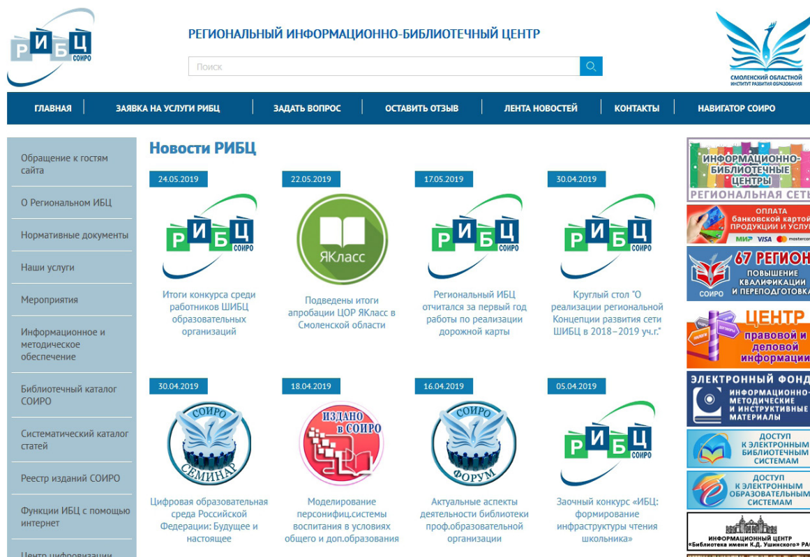
Рис. 2. Главное окно сайта Регионального информационно-библиотечного центра

– Подписка на издания. Предоставляется возможность предварительного оформления заказа (подписки) на издания Смоленского областного института развития образования, которые планируются к изданию в текущем году.