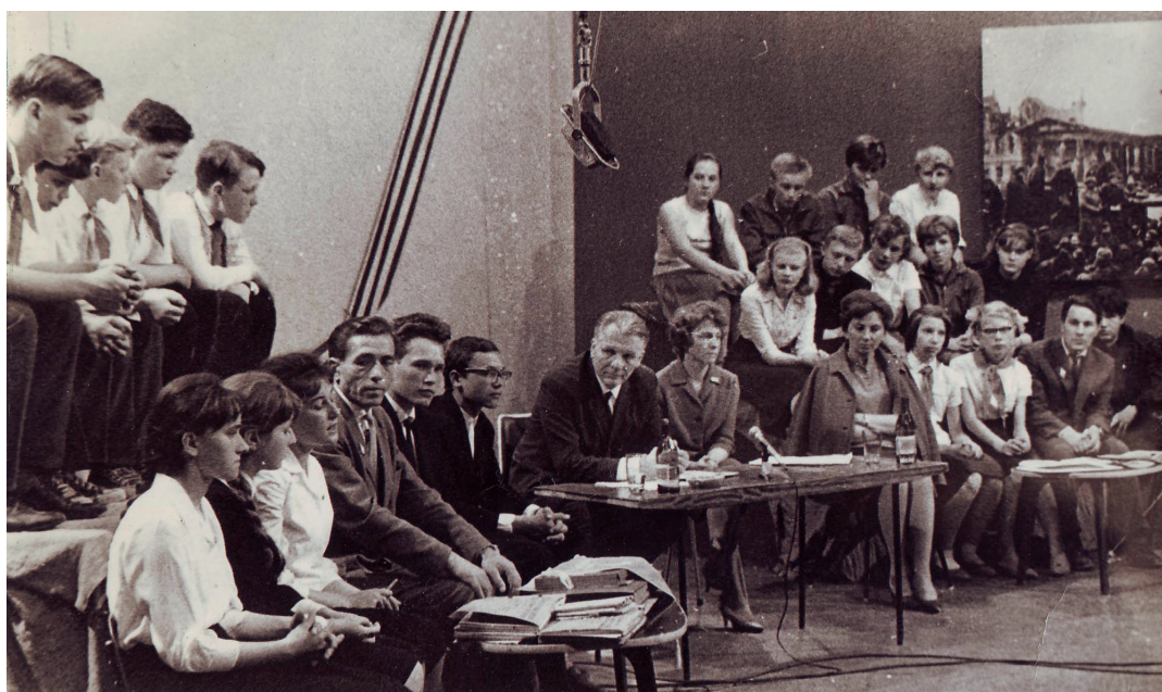
Ученики школы на центральном телевидении 60-е

В течение 9 лет был собран богатейший материал (свыше 2 тысяч экспонатов) по истории родного города, о знаменитых земляках – участниках гражданской и Великой Отечественной войн, о партизанском движении в Ярцевском районе, о восстановлении разрушенного